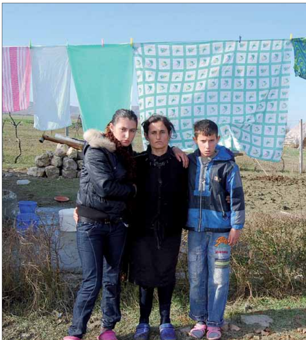
Emilie und ihre Kinder trauern um ihren kurz zuvor verstorbenen Ehemann und Vater.

Projekt Nr. 1470 „Kuh für Familie Tatani“