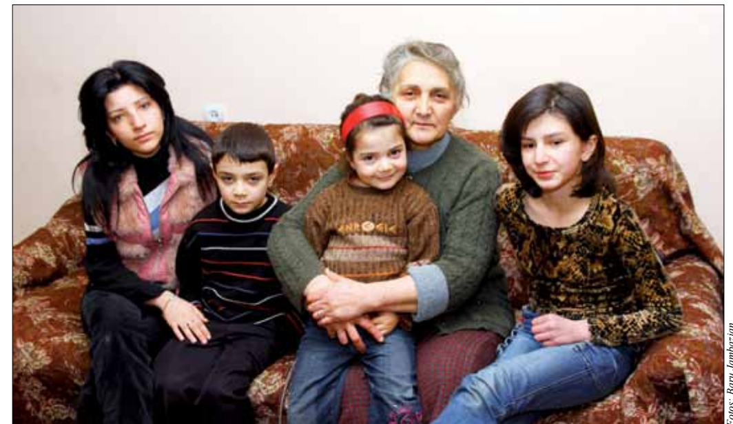
Die Grossmutter mit ihren Enkelkindern. Für das Foto haben sich alle herausgeputzt. Tatsächlich ist die Familie so arm, dass es nicht genügend zu essen gibt.