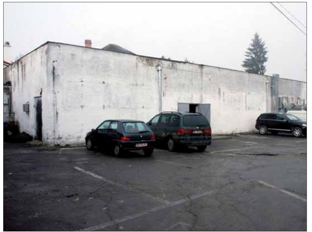
Dringend renovierungsbedürftig: Dieses Gebäude soll die Gemeinde in Zukunft beherbergen.