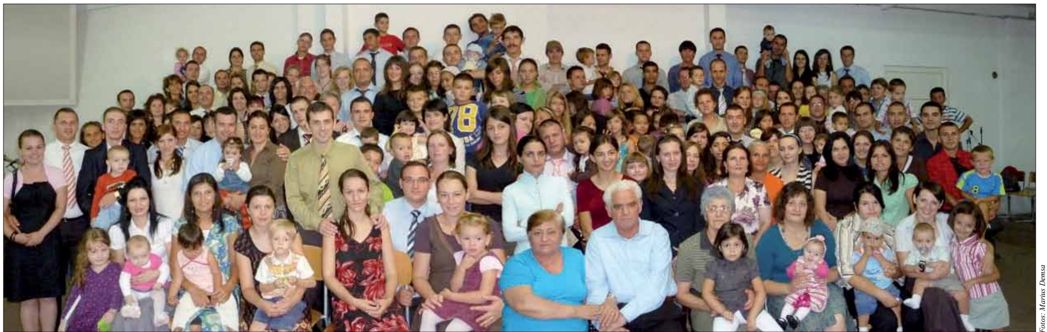
Menschen aus allen Altersgruppen haben in der Gemeinde ihre geistliche Heimat gefunden.