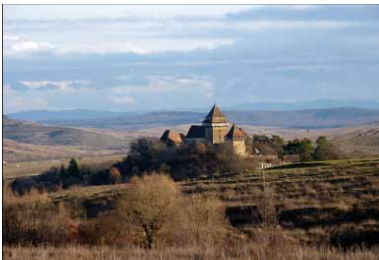
Kirchenburg von Viscri