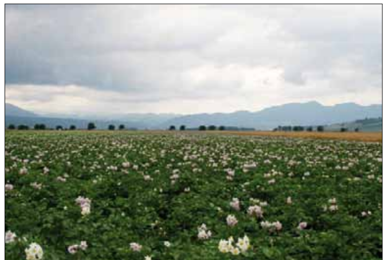
Erstes Kartoffelfeld von Diaconia