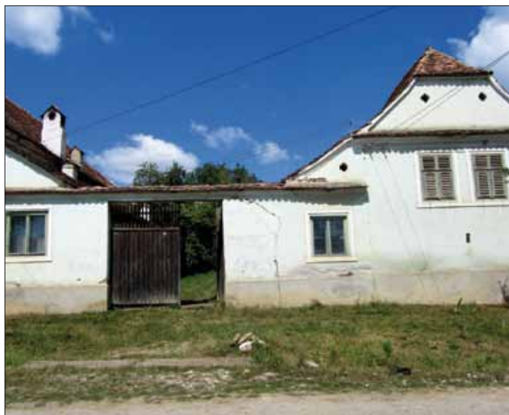
Haus welches Diaconia kaufen möchte

Um den Diaconia-Bauernhof aufzubauen, werden nicht nur Ackerland und Bäume gebraucht, sondern auch Scheunen, Lager- und Wohnräume. „Wir möchten Ihnen zu gegebener Zeit die Möglichkeit bieten, den Bauernhof der Hoffnung zu besuchen und hier bei uns zu übernachten. Auch wenn in Rumänien noch viel von Hand erledigt wird – für den Bauernhof sind ein leistungsfähiger Traktor und landwirtschaftliche Geräte unverzichtbar. Mit Ihrer Unterstützung helfen Sie mit, den „Bauernhof der Hoffnung“ ein gutes Stück voranzubringen. Diaconia hat die Möglichkeit, ein geeignetes altes Siebenbürger-Sachsenhaus sehr günstig für 30.000 Euro zu kaufen. Eine Spende für den Bauernhof der Hoffnung wird viele Jahre Frucht bringen und vielen Familien helfen!