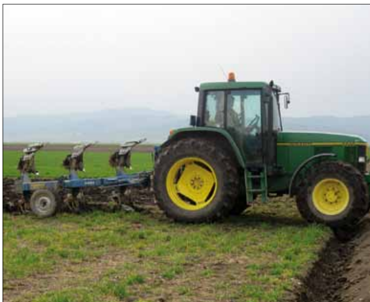
Ohne Traktor geht es nicht