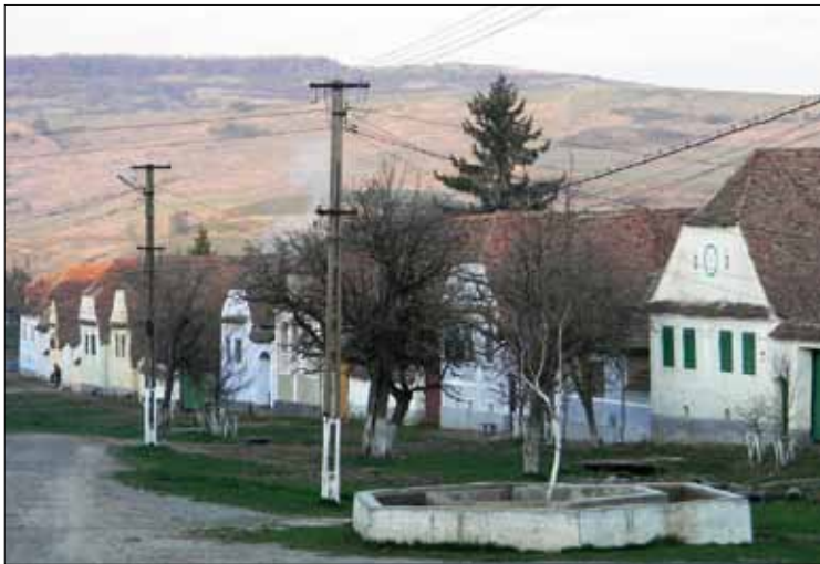
Strasse in Viscri